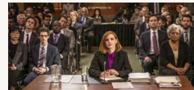
DIE ERFINDUNG DER WAHRHEIT

22:00 Mein wunderbares West-Berlin Fr/So/Di DFMEU Dokfilm, DE 2017, 97' Regie: Jochen Hick